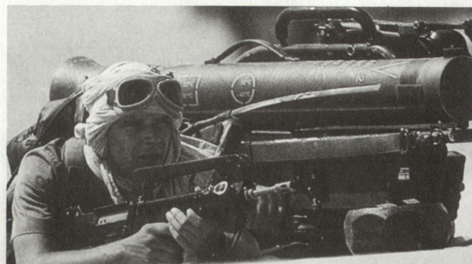
Französischer Soldat im Golfkrieg, ausgerüstet mit PAL-System Milan.

Gemäss Aussagen von Verteidigungsminister Pierre Joxe sind gegenwärtig folgende Pla-