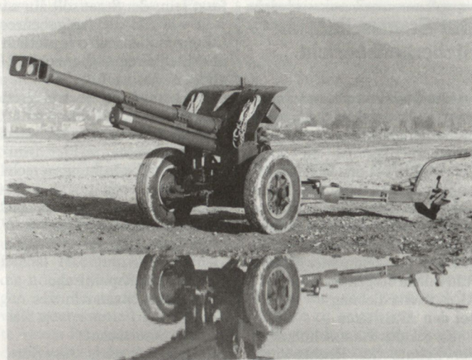
Rüstungsprogramm 91: 10,5-cm-Haubitze 46 mit gesteigerter Reichweite

durch Kampfwertsteigerung der Panzerabwehr-Lenkaffen Dragon und Ersatz des Raketenrohrs durch die Panzerfaust;