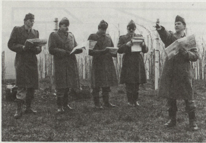
Abb. 2: Arbeit einer Gruppe im Gelände.