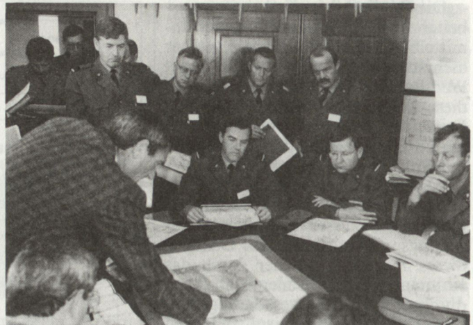
Abb. 3: Für spezielle Übungen werden auch zivile Experten bei gezogen.