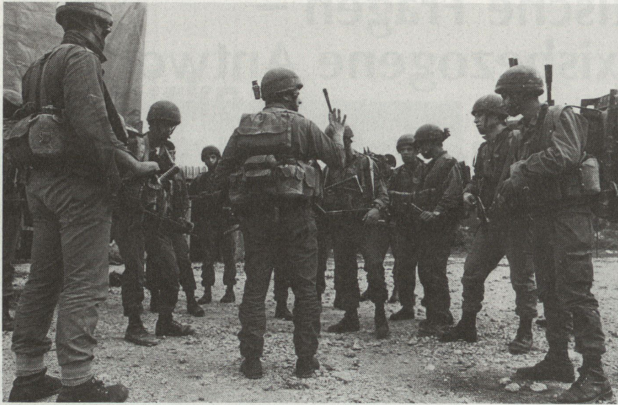
Informieren und überzeugen sind wichtige Voraussetzungen für eine erfolgreiche Auftrags-taktik.

ren. Die Begründung des stellvertretenden Schulkommandanten ist kurz und klar: «Führung lernt man am besten im Infanterie-Handwerk, und das Schulmotto lautet: You are the example – Du bist das Vorbild! »