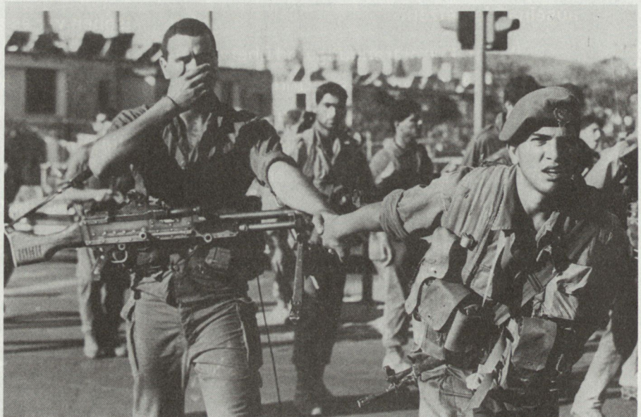
«Führung von vorn» kann auch einmal so aussehen...