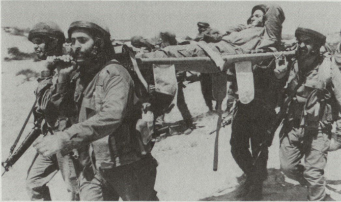
Für seine Leute zu sorgen und die Fürsorge sicherzustellen, gehört zu den wichtigsten Aufgaben eines militärischen Führers.

und das ist in den Ausbildungsphasen sehr oft der Fall, lautet die Reihenfolge: