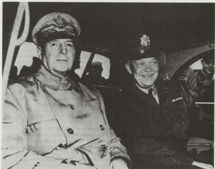
MacArthur und Eisenhower in Japan im Mai 1946.

Im Alter von 38 Jahren wird MacArthur Divisionsgeneral, Kommandant der Regenbogendivision; er gerät bald einmal in Widerspruch und Streit mit dem Hauptquartier der Amerikaner in Frankreich, dessen Chef Georg Marshall heisst, später Chef des Vereinigten Generalstabes der USA im Zweiten Weltkrieg. Die dauernden Schwierigkeiten, die MacArthur während seiner über 50jährigen Karriere in der amerikanischen Armee begleiten, führt er auf diese Differenzen zurück, ohne zu erkennen, dass sein