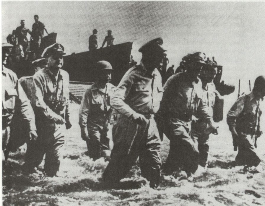
Wie er vorausgesagt hatte, kehrte er (im Oktober 1944) als Sieger auf die 1941/42 von Japan eroberten Philippinen zurück.

den nach Norden. Drei grosse Seeschlachten, die zum Teil mit Aktionen MacArthurs im Zusammenhang standen, wurden geschlagen und zerstörten Flotte und Luftwaffe der Japaner: Die Schlacht in der Coral Sea, die Schlacht um Midway und die Schlacht im Leyte-Golf, bei der Landung der Armee unter MacArthur auf den Philippinen, die sein berühmtes Versprechen wahr machte: «Ich werde zurückkommen.»