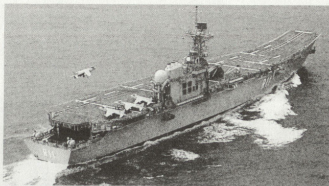
Der V/STOL-Flugzeugträger «Principe de Asturias» (Länge 196 m, Breite 24,4 m, Pistenbreite 29 m, 800 Mann Besatzung). Ein Harrier AV-8B ist auf dem Landeanflug.

Bis auf eine Distanz von 350 Meilen kann die Flab gegnerische Flugzeuge entdecken. Tieffliegende Lenkwanne und andere Flugkörper sollten von den Heli SH-3A AEW aufgespürt werden, während die Radars die Einsatzräume der