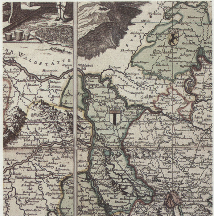
Abb. 1: Aus der Schweizerkarte Johann Jakob Scheuchzers (1712).

Weit davon entfernt, durch eine Verbesserung des Zugangs zu geographischer Information kriegstreibend zu wirken, hat hier also die Militärkarte einen rationalen Entscheid gegen den Krieg ausgelöst. Immerhin, eine allzu genaue Kenntnis des eigenen Landes bei Fremden galt den Völkern zu allen Zeiten als unerwünscht, der Schutz auch geographischer Information als patriotische Pflicht. Umgekehrt wollte man selber natürlich über möglichst genaue Kenntnisse verfügen, über umso genauere, je weiter sich die militärische Technik entwickelte. Davon ausgehend müsste man annehmen, alle Karten wären geheimgehalten worden. Dass dies nicht durchwegs der Fall war, ist einerseits dem Ehrgeiz der Kartographen, andererseits dem Erfordernis des Broterwerbs zuzuschreiben. Es wurde also publiziert, so etwa 1712 die Schweizerkarte des Zürcher Professors Johann Jakob Scheuchzer (Abb. 1), über welche unser Historisch-Biographisches Lexikon sagt: «Ihre Bedeutung liegt neben der Zusammenfassung des bisher Erreichten im Hinweis auf die Not-