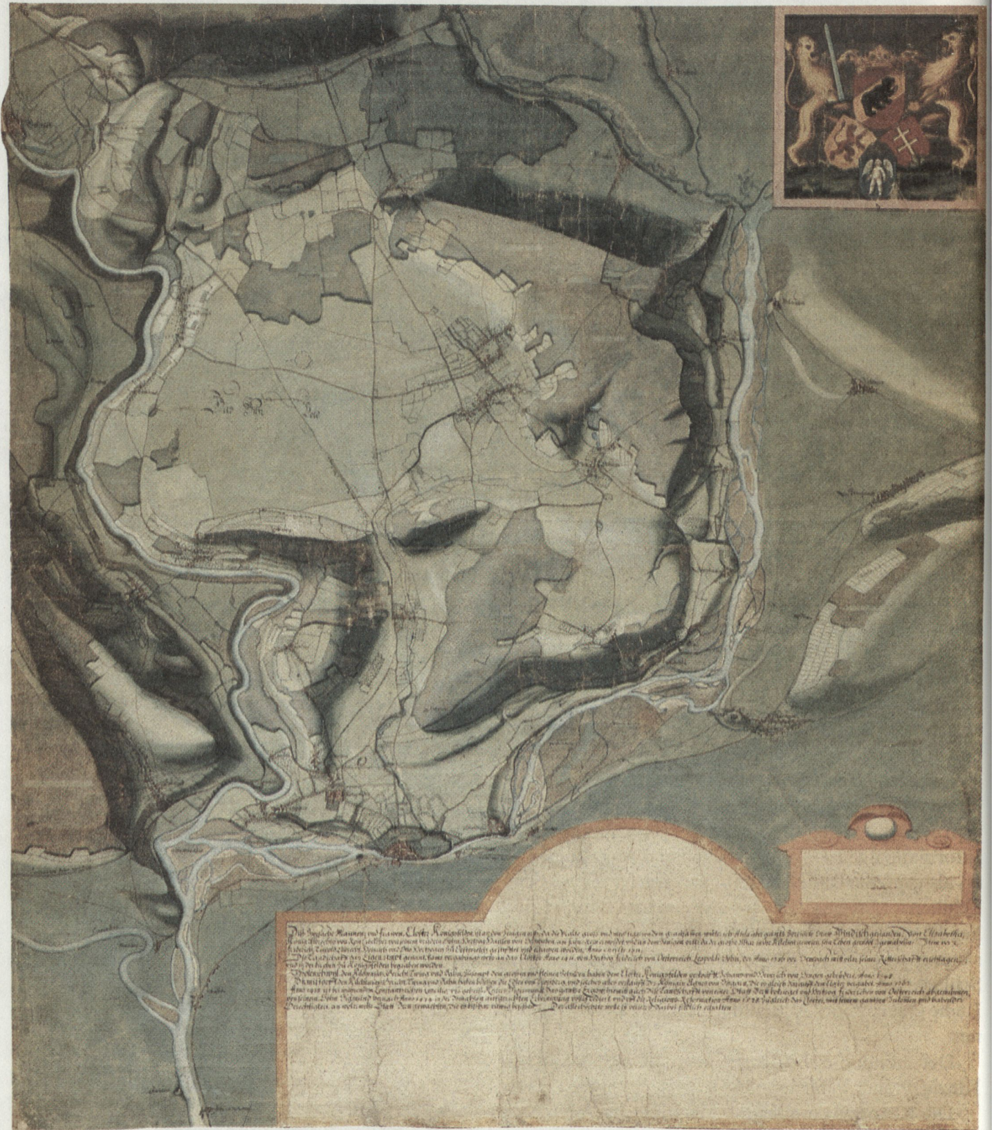
Abb. 2: Hans Conrad Gygers Karte des Wasserschlosses, vom Hofmeister von Königsfelden 1660 dem bernischen Kriegsrat übergeben.

wendigkeit weiterer Forschung und Arbeit.» (HBL, s.v. Kartographie der Schweiz). Wer Scheuchzers Karte mit dem Werk Hans Conrad Gygers (Abb. 2) vergleicht, erkennt die Spannweite zwischen der vergleichsweise harmlos-naiven zivilen Darstellung des Gebietes und der in allen Teilen zuverlässigen detaillierten Militärkarte.