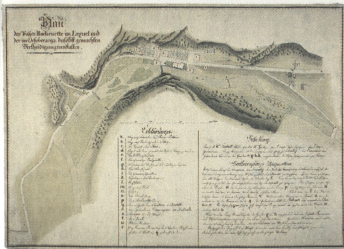
Abb. 9: Verteidigungsplan für das Reuchenette-Engnis.