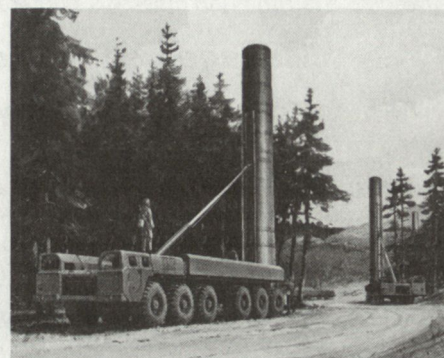
SS-12 (oben) und SS-20 (unten), die beiden wichtigsten Lenkwaffensysteme, die von der UdSSR verschrottet werden müssen.

Im Bereich der vorgesehenen Verifikationen wurden sehr weitgehende Beschlüsse gefasst. Während der ersten 6 bis 12 Monate nach der Ratifikation werden beide Seiten ermächtigt, die von der Gegenseite gemachten Zahlenangaben zu überprüfen. Ferner dürfen während der ersten drei Jahre nach Ratifikation beide Seiten bis zu 20 Inspektionen pro Jahr mit jeweils nur kurzer Vorankündigung durchführen. In den folgenden fünf Jahren sinkt dann diese Zahl von Inspektionen auf 15 pro Jahr ab, in den nächsten Jahren auf noch 10 pro Jahr.