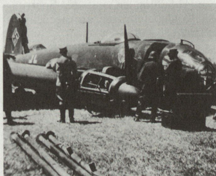
Abb. 3: Der zur Notlandung gezwungene Heinkelbomber bei Ursins.

Danach bildeten die drei Zerstörerstaffeln 4, 5, und 6 mit dem Stabschwarm drei Abwehrkreise auf 2000, 4000 und 6000 m Höhe, um die Schweizer Jäger in dieses leicht zu verteidigende Turmdispositiv zu locken. Diese Abwehrkreise schwappten auf Schweizer Gebiet hinüber. Der Abschuss von Rickenbacher zwei Tage vorher, und jetzt der C-35-Besatzung, gab den schweizerischen Jagdpiloten zusätzlichen Kampfgeist. Auf eigenen Entschluss liessen die Kommandanten der Kompanien 6, 15 und 21 alle flugbereiten Me-109 starten, 15 an der Zahl. Von Olten, Thun und Dübendorf flogen sie den Me-110 entgegen und griffen aus 7000 m Höhe immer wieder einzelfliegende Zerstörer an. Ein wilder Luftkampf tobte im Raum Saignelégier-Oensingen-St-Ursanne und riss den Zerstörerverband auseinander. Hauptmann Hörning: «Es war ein Kampf mit ungleichen Mitteln. Waren wir im Angriff einmal in den Turm geraten, mussten wir feststellen, dass sich mindestens 1 bis 2 Schwärme aus höheren Stockwerken feuernd auf uns herabstürzten. Wir mussten also wohl oder übel nach vorne das Feuer einstellen und im vertikalen Kampfmanöver, das wir als Dégagement gegen einen in günstigerer Position befindlichen Gegner im Schweiss unseres Angesichts