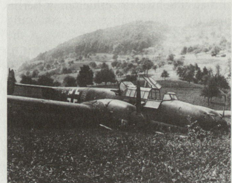
Abb. 4: Der Zerstörer Me-110 in Oberkirch von Flab-Geschossen getroffen und notgelandet.