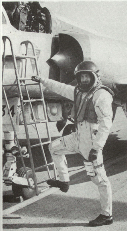
Bild 1. Mirage-Pilot im Druckanzug.

Bei den Piloten lassen sich drei verschiedene Kategorien unterscheiden: Jagdpiloten, Erdkampf- und Aufklärungspiloten sowie Transportpiloten. Jagdpiloten werden auf den Flugzeug-