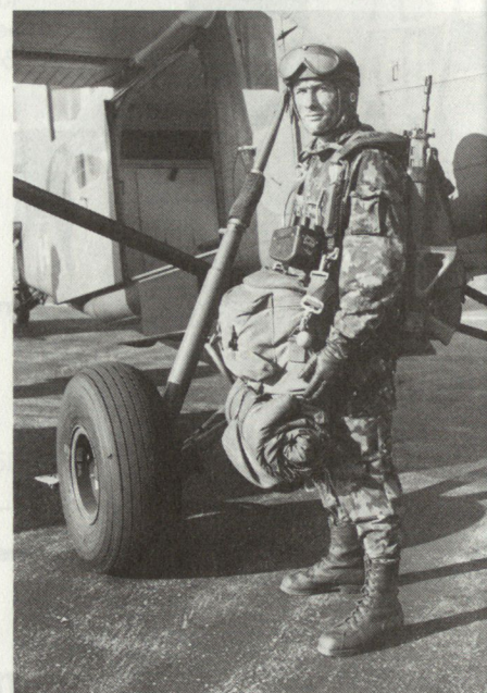
Bild 4. Fernspäher mit voller Ausrüstung für den Fallschirmabsprung (mit Stgw 90).

Eine Fernspäheraktion beginnt etwa 12 Stunden vor dem eigentlichen Einsatz mit einer aus Geheimhaltungsgründen von der Umwelt abgeschirmten Auftragserteilung an den Fernspähertrupp. In der Vorbereitungszeit erarbeitet der Trupp alle Unterlagen für den Einsatz. Das Verhalten bei der Infiltration wird repetiert, die Arbeit im Besammlungsraum und die besonderen Nachrichtenbedürfnisse der vorgesetzten Stelle sowie das Verhalten im Feindgebiet und bei der späteren Exfiltration werden besprochen. Nach Abschluss dieser Vorbereitung schleust sich der Fernspähertrupp – in der Regel 4 Mann (1 Offizier, 2 Unteroffiziere und