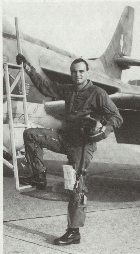
Bild 2. Erdkampf-Pilot vor dem Einsatz mit Hunter.

Mirage-Aufklärer- und Hunter-Erdkampfpiloten unterscheiden sich in mancher Hinsicht vom Jagdflieger. Sie fliegen sehr oft in Bodennähe über der Kampfzone und sind der gegnerischen Fliegerabwehr ausgesetzt. Ihre offensive Aufgabe, nämlich die Aufklärung über Feindgebiet oder die Bekämpfung von Zielen am Boden, prägt sie deshalb ganz besonders. Vom Aufklärer und Erdkämpfer wird verlangt, dass er bei ausgezeichneter körperlicher und geistiger Verfassung in kurzer Vorbereitungszeit komplexe Lagebeurteilungen durchführen und rasch Entschlüsse fassen kann. Ein gutes Erinnerungs-