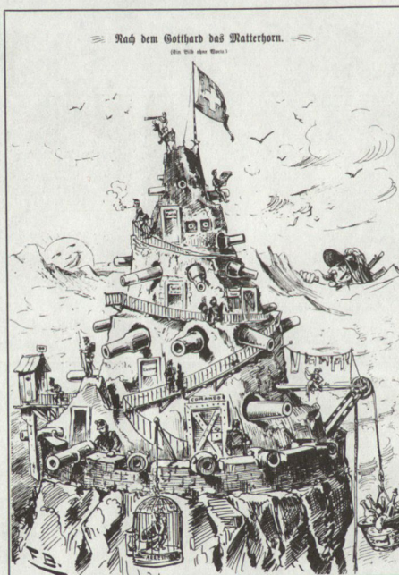
Auch der «Nebelspalter» griff zu Beginn der 1880er Jahre in die Diskussion um die Landesbefestigung ein.

Die Bauten begannen 1886 am Südportal des Gotthardtunnels und am