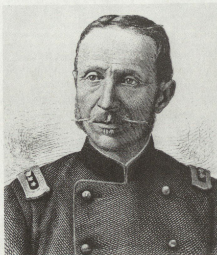
Oberst Alphons Pfyffer (1834–1890)

Zum Jubiläum «100 Jahre Gotthard-Festung» hat eine Arbeitsgruppe der Fest Br 23 in den kurzen Dienstzeiten, vor allem aber in ungezählten Stunden ausser Dienst, eine Ausstellung geschaffen, die bis zum 2. März 1986 im Schweizerischen Landesmuseum in Zürich zu sehen ist. Sie gibt auf rund zwanzig reich bebilderten Tafeln historische und aktuelle Informationen über die Gotthard-Festung und zeigt in einer Schau von Modellen und historischen Gegenständen den Wandel in Waffentechnik und Uniformierung, die Fortschritte bei der Übermittlung und im Sanitätsdienst, aber auch die Entwicklung zu höherem Komfort und vermehrter Sicherheit in den Festungen.