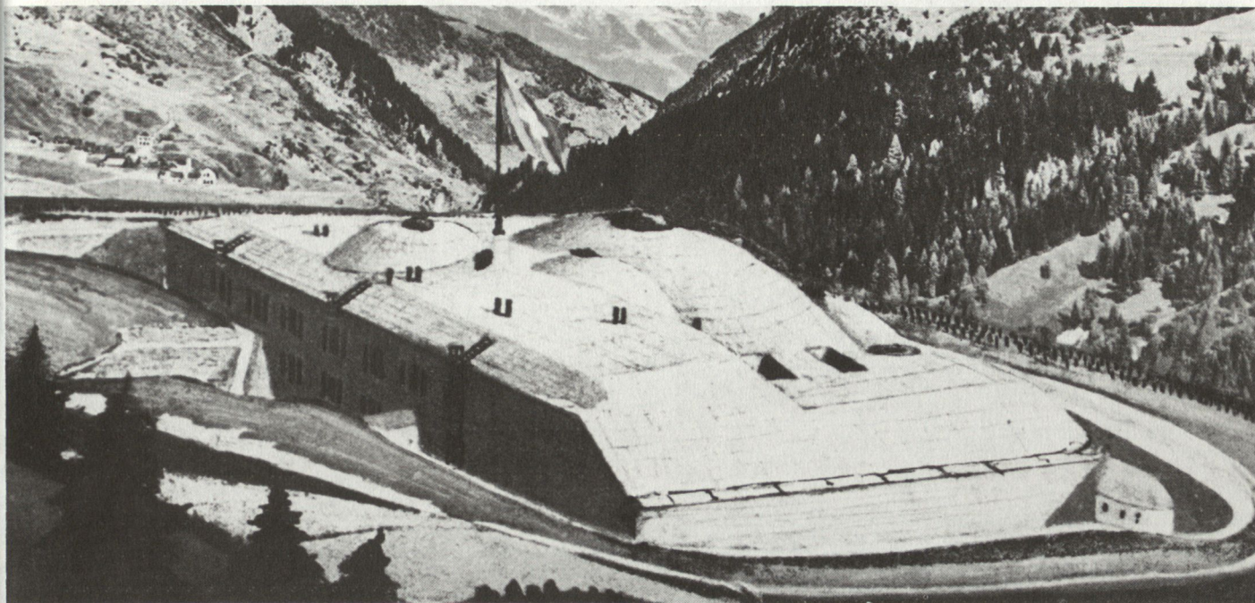
Das Fort Airolo, ursprünglich Fondo del Bosco genannt, bildete das Hauptwerk der Gotthard-Befestigung.