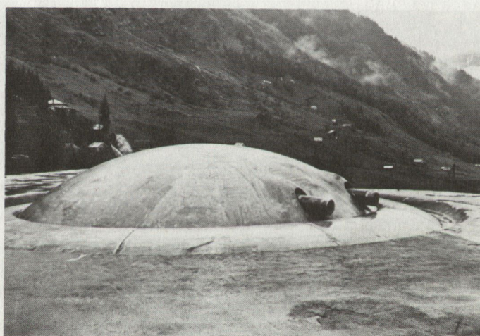
Fort Airolo. Zwillingspanzerturm für 12-cm-Kanonen.