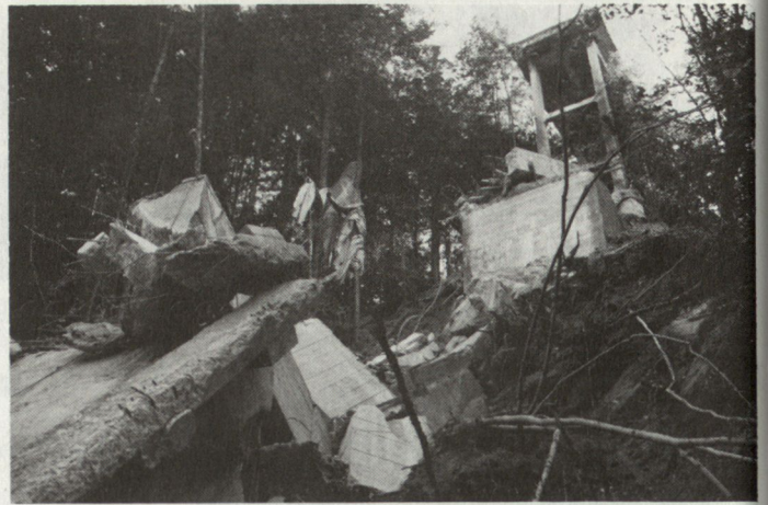
Gesprenge Brücke. Unser Verkehrsnetz ist zur Sprengung vorbereitet.