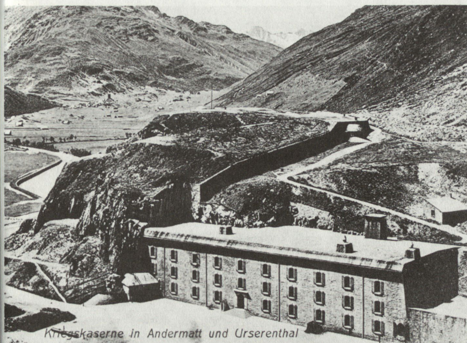
Kriegskaserne in Andermatt und Urserenthal