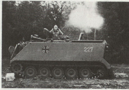
Mw 120 mm auf M 113

Als geschütztes Transportmittel dient der Schützenpanzer M 113.