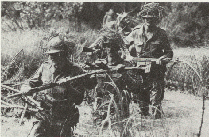
Abgesessene Panzergrenadiere im Einsatz