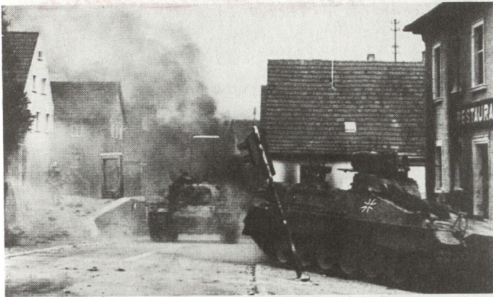
Schützenpanzer MARDER im Ortskampf