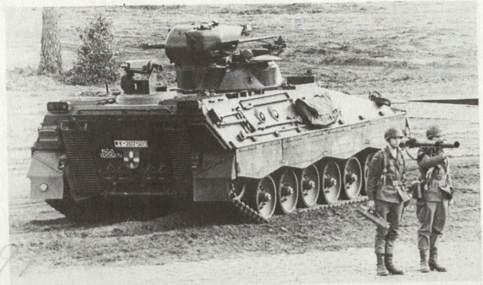
Schützenpanzer MARDER und Panzerabwehrlenkwaffe MILAN