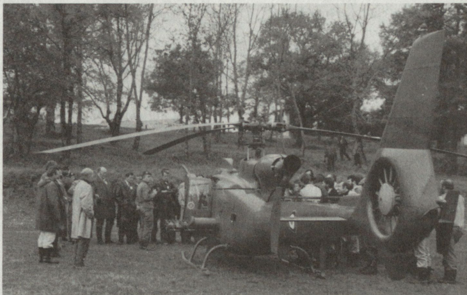
Bild 1. Panzerabwehr-Helikopter Gazelle. Auf der linken Seite erkennt man die Träger der Luft-Boden-Lenk Waffen.

Das vom «Groupement industriel des armements terrestres», verantwortliche Instanz für die Entwicklung des AMX 32, herausgegebene technische Merkblatt legt besonderes Gewicht auf die Mobilität des Panzers im Gelände . «Das Vorwahlgetriebe mit elektrohydraulischer Steuerung (...) gewährt eine grosse Steuerfeinheit und verbessert weitgehend die Beschleunigung des Panzers. Die Steuerung erfolgt durch ein Steuerrad ohne Steuerbremse.» Der aus laminierten und geschweissten Stahlplatten bestehende Vorderteil des Chassis, der stark profilierte und mechanisch geschweisste Panzerturm sowie die Panzerplatten für den Schutz