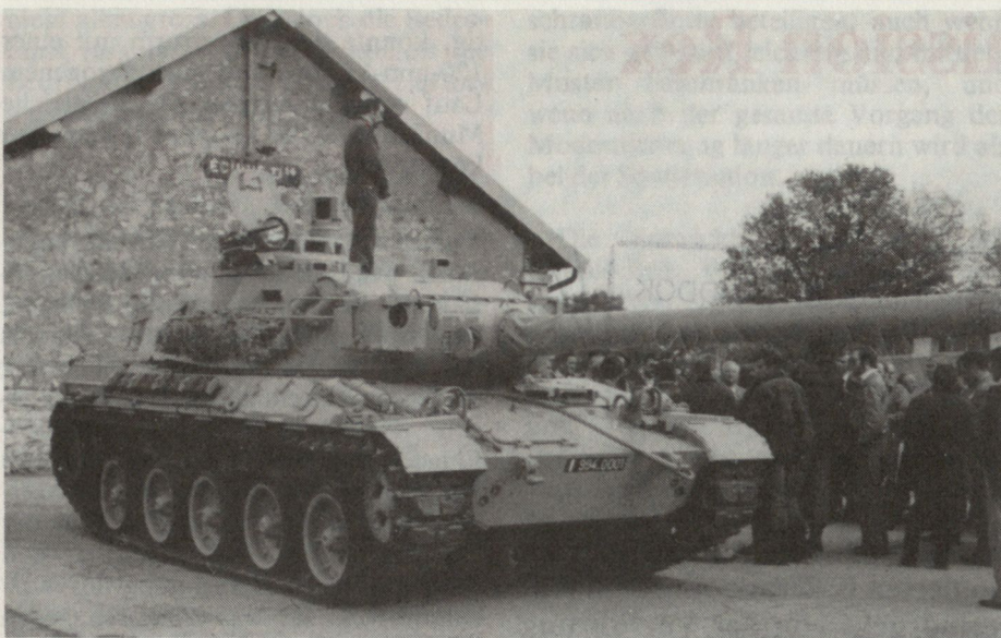
Bild 2. Der AMX 32, von Fachleuten des «Groupement industriel des armements terrestres» präsentiert. Bei der Kanone erkennt man die Öffnung des Laser-Telemeters und die lichtschwache Kamera.