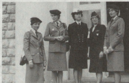
Frauen in der französischen Armee

Für das freiwillige Dienstjahr für Frauen in den nichtkämpfenden Einheiten der französischen Armee werden jährlich 400 Bewerberinnen angenommen. Diese bilden den Kern der weiblichen Reserve für den Mobilmachungsfall. Die Auslese für den Service National ist hart. Es melden sich jedes Jahr weit über 1000 Mädchen. Das Bildungsniveau der Bewerberinnen steigt von Jahr zu Jahr. 1976 beispielsweise besaßen 50 Prozent das Abitur. Das Hauptmotiv der Bewerberinnen ist die Aussicht, im Anschluss an den Service National im Staatsdienst und Berufsmilitär Aufnahme zu finden. Sie haben Vorrechte bei der Einstellung in den öffentlichen Dienst. Bei der Dienstzeitberechnung im öffentlichen Dienst wird das freiwillige Dienstjahr ebenso angerechnet wie bei der Pensionsleistung. Alter für die Aufnahme: zwischen 18 und 27 Jahren.