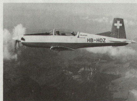
Pilatus Turbotrainer PC-7 (Fachpresse: «Swiss Perfection»).

Ein Bericht über Farnborough darf nicht schliessen ohne Kompliment an die Kunstflugstaffel der Royal Air Force, die «Red Arrows». Elegant, beschwingt und bei