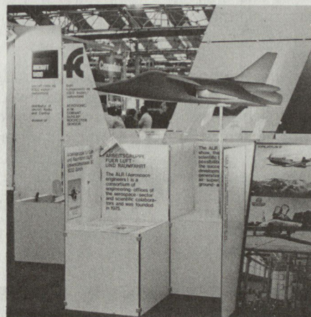
«Piranha» – Projekt eines leichten Kampfflugzeuges der Arbeitsgruppe für Luft- und Raumfahrt, Zürich.