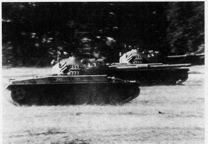
Bild 3. Panzer und Panzergrenadiere haben gemeinsam eine Krette genommen.