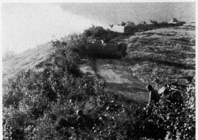
Bild 2. Pz 61 im Vormarsch