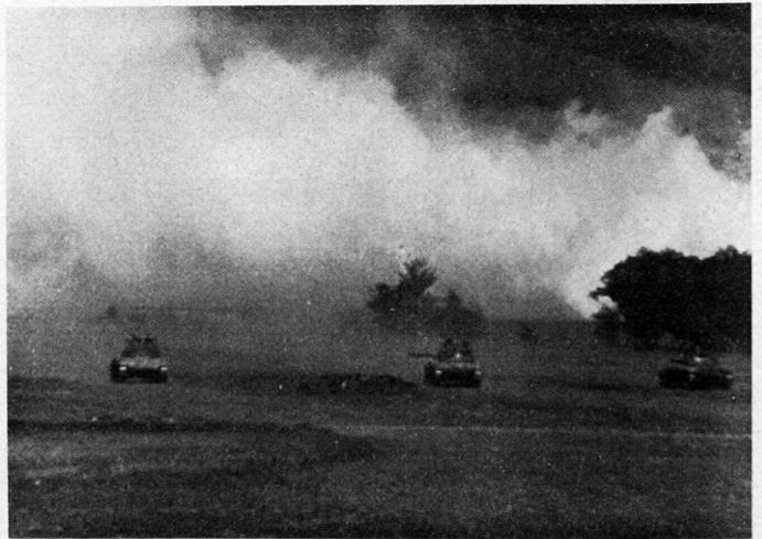
Bild 1. Einsatz von Panzern im Schutze der Nebelwand

Es ging vor allem darum, klar zum Ausdruck zu bringen, daß sich der Gegenschlag gegen den in den Abwehrraum eingedrungenen Gegner richtet, während es sich beim Gegenangriff um die Wiederinbesitznahme von verlorengangenen Gelände handelt. Die gezeigte Übung demonstrierte diese beiden Kampf-formen äußerst klar und prägnant. Gleichzeitig konnte mit dem Einsatz von zwölf «Mirage»- Flugzeugen gezeigt werden, daß derartige Aktionen eines Luftschirmes bedürfen und daß unsere Flugwaffe neben dem Erdsatz vor allem Aufgaben des Raumschutzes und der indirekten Unterstützung übernehmen muß. Eindrücklich waren neben dem äußerst flüssig vorgetragenen Vorstoß der Panzer und Panzergrenadiere die geschossenen Feuer des Hb Rgt 4.