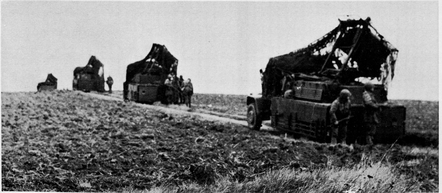
Bild 8. Raketenwerferbatterie mit 4 RM 130 auf Lkw Praga V3S, 12 t, G_{\text{RAK}} 26 kg, V_0 410 m/sec, Schußweite 8,2 km, Feuergeschwindigkeit 300 Schuß/min.