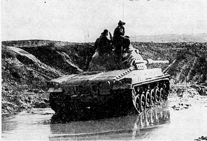
Bild 2. Gefechtstechnische Übung im Fahrschulgelände von Thun.

Die gefechtstechnischen Übungen des vergangenen Wiederholungskurses ließen einen weiteren enormen Vorteil einer «Rekruteneinheit» erkennen. Bei der großen Beanspruchung des Panzerkommandanten im Gefecht (er muß die Verbindung mit seinem vorgesetzten Führer aufrechterhalten und die für sein Fahrzeug in der Verbandsformation zweckmäßige Geländewahl