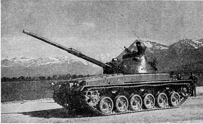
Bild 1. Der Pz. 61.

der Rekrutenschule während der Wiederholungskurse in kürzester Zeit ausgefüllt werden können, beweist das Gesagte und braucht wohl nicht näher begründet zu werden.