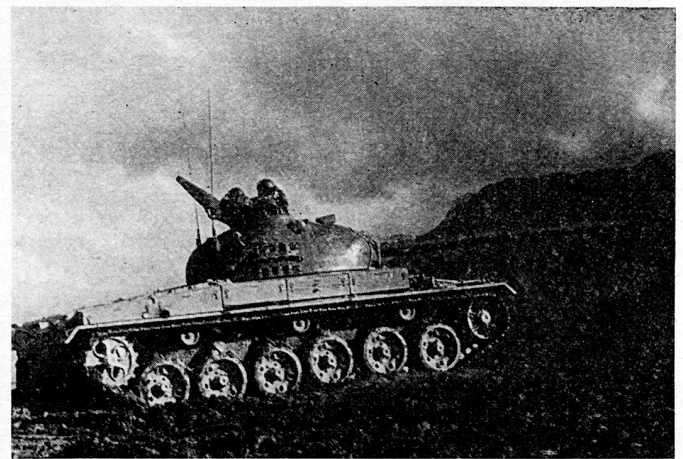
Bild 4. 10,5-cm-Schießen auf dem Gurnigel.