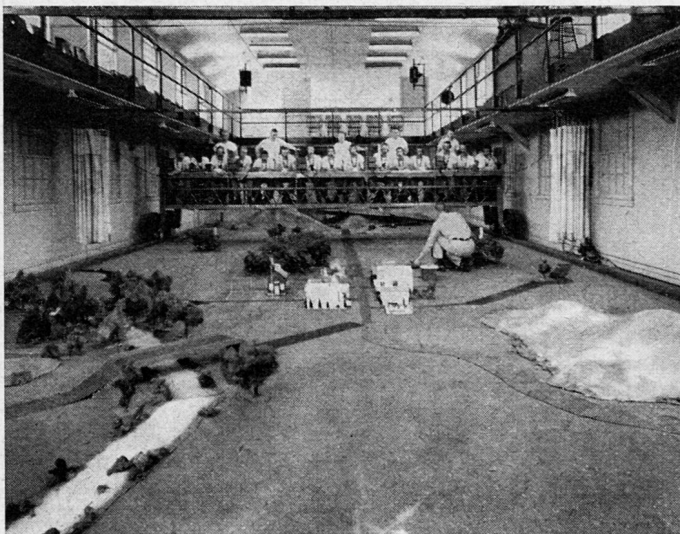
Bild 2. Ansicht des Miniatur-Panzerschlachtfeldes mit der Brücke für die fünf Panzerbesetzungen (amerikanische Panzerzüge bestehen aus fünf Panzern)

Bevor eine Übung beginnt, erhält der Zugführer seinen Auftrag und eine Karte des Gefechtsfeldes. Dies geschieht in der Form einer normalen Befehlsausgabe. Nachdem der Zugführer seinen Auftrag kennt, kann er persönlich das Gelände rekognoszieren und seinen Schlachtplan entwickeln. Danach instruiert er seinen Wachtmeister und seine Panzerkommandanten und