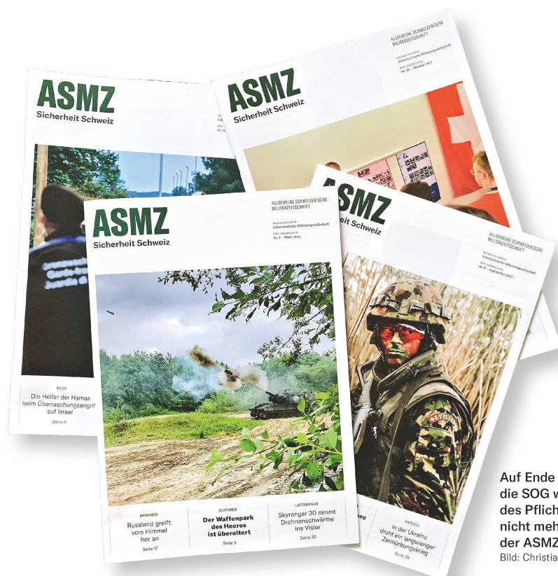
Auf Ende dieses Jahres wird die SOG wegen der Aufgabe des Pflichtabonnements nicht mehr Herausgeberin der ASMZ sein.

Das historische, zentrale Verkaufsargument der ASMZ, jene Militärzeitschrift zu sein, die mit ihrem Inhalt militärische und zivile Führungskräfte anspricht, funktioniert in der heutigen Zeit nur noch teilweise. Die Veränderungen in den Chefetagen unserer Schweizer Wirtschaft sind aufgrund der Globalisierung und der stark verkleinerten