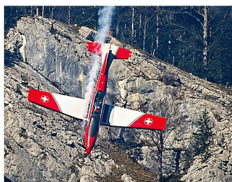
Das PC-7-Team zeigte trotz Wetterkapriolen am Luftwaffenrapport eine beeindruckende Vorstellung.

Der dichte Nebel am Morgen des 31. Oktober in Meiringen liess wenig Hoffnung aufkommen, dass geflogen werden könnte. Immerhin standen auf dem Programm