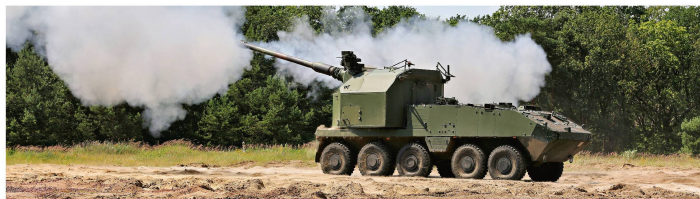
Das 155-mm-Artillerie-Geschütz-Modul AGM auf dem 10×10-Trägerfahrzeug Piranha IV von Mowag kann über 360 Grad wirken.

In der Ausschreibung um ein neues Artilleriesystem für die Schweizer Armee hat sich KNDS Deutschland gemeinsam mit General Dynamics European Land Systems (GDELS) durchgesetzt. Laut Beschaffungsbehörde Armasuisse ist die Auswahl auf das 155-mm-