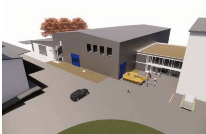
Modell für das Projekt der neuen Museumshalle: Links ist die bereits realisierte Depothalle zu sehen, an die sich rechts davon die geplante neue Museumshalle anschliesst. Später soll noch weiter rechts davon ein neuer Museumseingang erstellt werden. Dieses Vorhaben ist aber bis auf Weiteres zurückgestellt. Grafik: PD

Seit 2022 ist das Militärmuseum Full daran, sich zu erweitern. Aktuell läuft die Finanzierung der zweiten Phase, die im Wesentlichen den Bau einer weiteren Ausstellungshalle sowie die Umsetzung eines neuen Ausstellungskonzeptes umfasst. Die Gesamtkosten dafür belaufen sich auf rund 4,3 Millionen Franken.