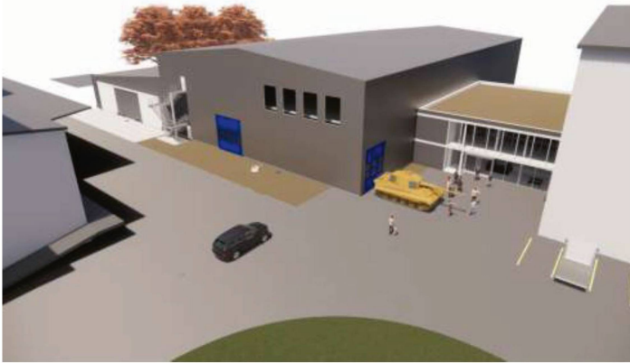
Modell für das Projekt der neuen Museumshalle: Links ist die bereits realisierte Depothalle zu sehen, an die sich rechts davon die geplante neue Museumshalle anschliesst. Später soll noch weiter rechts davon ein neuer Museumseingang erstellt werden. Dieses Vorhaben ist aber bis auf Weiteres zurückgestellt.

Seit 2022 ist das Militärmuseum Full daran, sich zu erweitern. Aktuell läuft die Finanzierung der zweiten Phase, die im Wesentlichen den Bau einer weiteren Ausstellungshalle sowie die Umsetzung eines neuen Ausstellungskonzeptes umfasst. Die Gesamtkosten dafür belaufen sich auf rund 4,3 Millionen Franken.