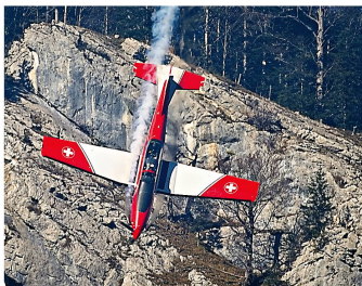
Das PC-7-Team zeigte trotz Wetterkapriolen am Luftwaffenrapport eine beeindruckende Vorstellung.

Der dichte Nebel am Morgen des 31. Oktober in Meiringen liess wenig Hoffnung aufkommen, dass geflogen werden könnte. Immerhin standen auf dem Programm