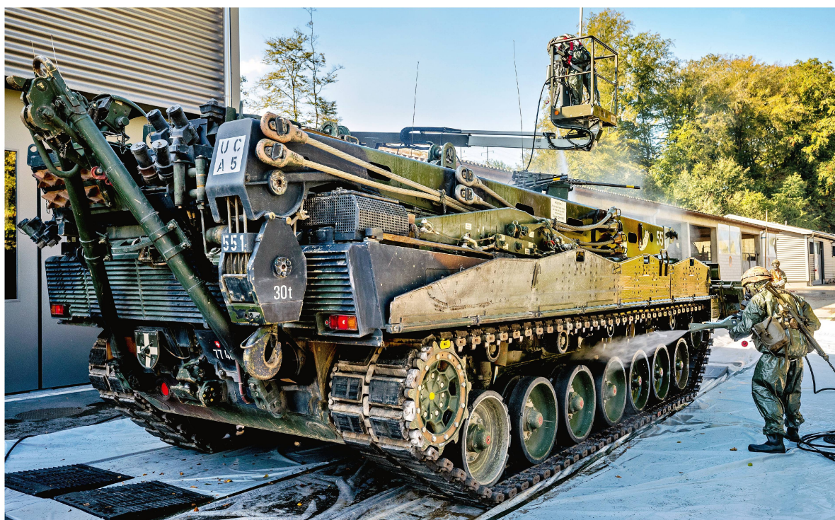
Ein Panzer wird dekontaminiert.