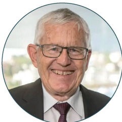
alt Bundesrat Kaspar Villiger