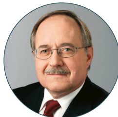
alt Bundesrat Samuel Schmid