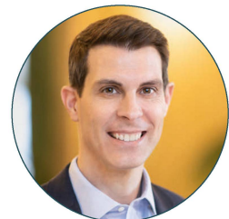
Ständerat Thierry Burkart

Die Platzzahl zum Anlass ist beschränkt.