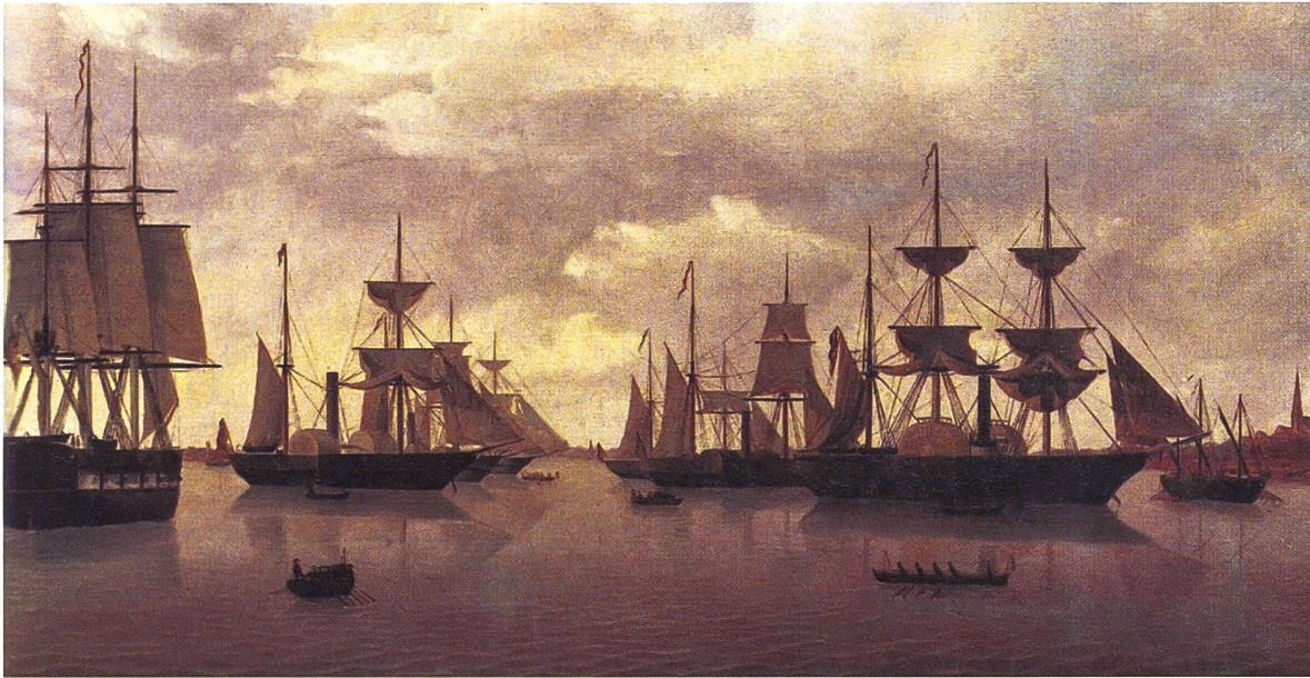
◀ Die Reichsflotte vor Bremerhaven, wo sie einen Stützpunkt hatte.