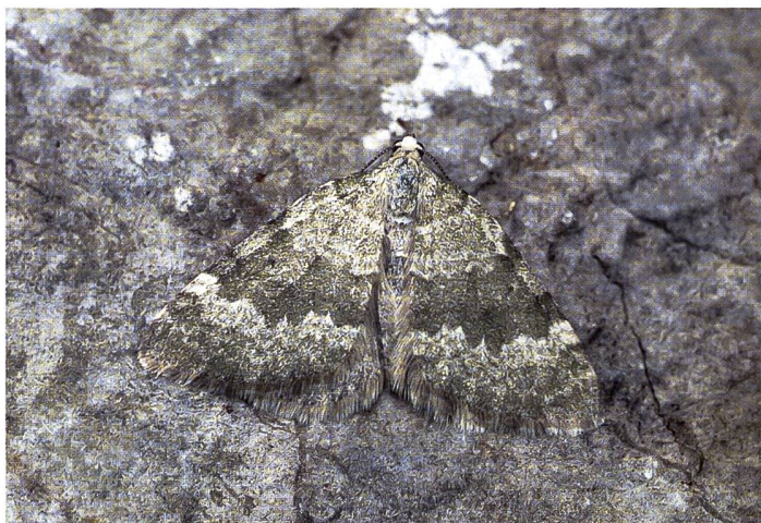
Die natürliche Tarnung eines Nachtfalters.

Beispiel: Ein Soldat mit der Körpertemperatur von 22 °C auf der Kleideroberfläche