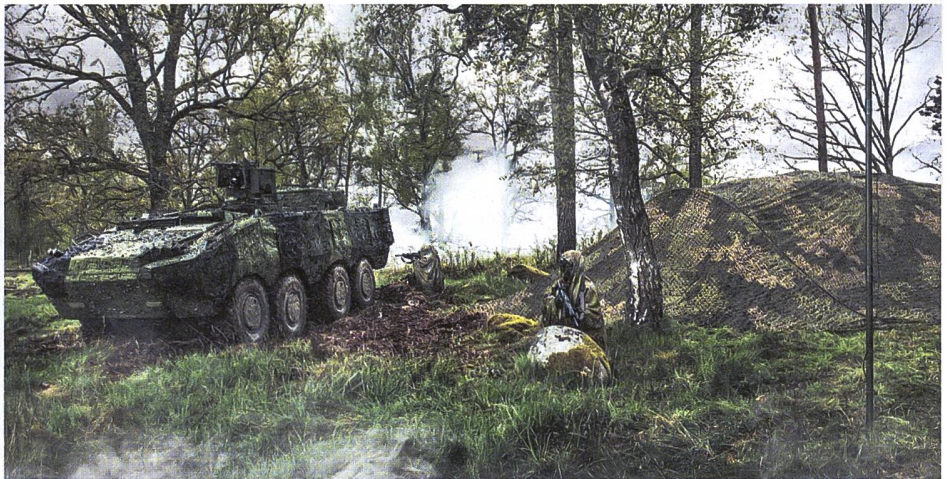
Visuelle Tarnung am Beispiel von Saab-Produkten.

Unabhängig vom Frequenzspektrum muss es somit das Ziel des Signaturmanagements sein, den Kontrast zur Umwelt zu reduzieren: