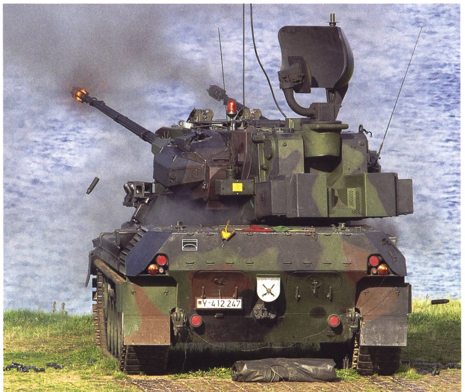
► Ein Gepard der Bundeswehr beim Schiesstraining auf Luftziele im Jahr 2004.

Technisch gesehen erfüllt der Gepard die an ein gepanzertes mobiles Flugabwehrsystem gestellte Forderung der Autonomie durch den Einsatz von Sensorik und einer Waffenanlage auf einer Plattform. Die Forderung nach einer grossen Wirksamkeit unter Allwetterbedingungen mit einer hohen Ab-