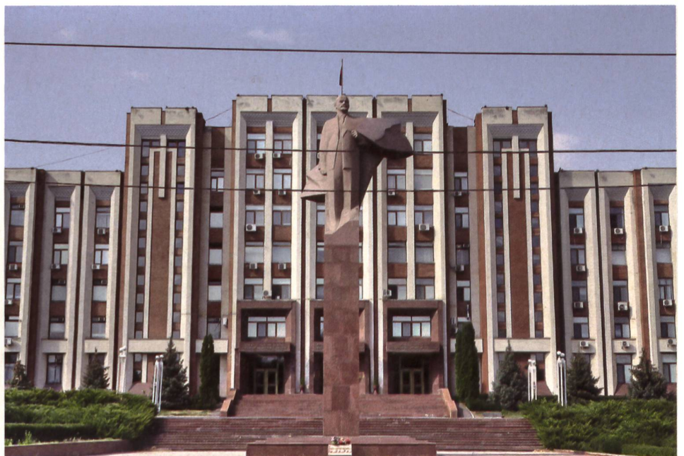
► Sowjetarchitektur vom Feinsten: Ein Regierungsgebäude samt Lenin-Denkmal in Transnistriens «Hauptstadt» Tiraspol.

Die UdSSR trieb die Industrialisierung der Städte entlang des Dnjestr voran. Dies