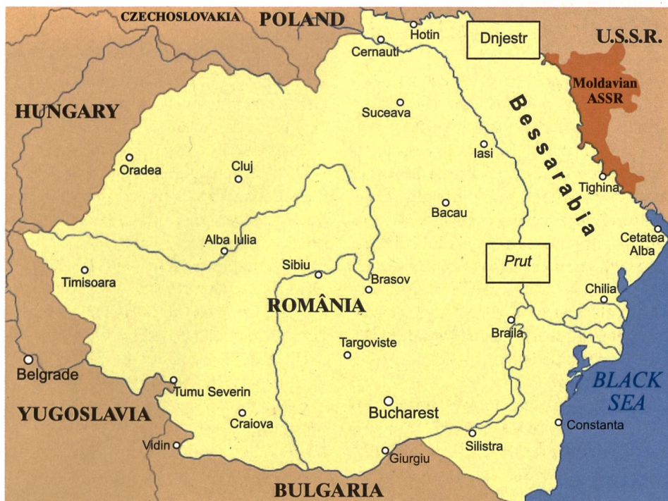
◀ Zur Moldauischen Autonomen Sozialistischen Sowjetrepublik wurde 1940 durch die Sowjets Bessarabien zugeschlagen, das von Rumänien abgetrennt wurde. Karte: Romania Insider

zog Einwanderer aus der ganzen Sowjetunion an; das heutige Transnistrien wurde, wie etwa der ukrainische Donbass mit seinen Stahlwerken und Kohlebergwerken, zu einem Schmelztiegel verschiedener Völker und zu einer sowjetischen Vorzeigeregion. Am Dnjestr lag das wirtschaftliche Zentrum der MSSR. Obwohl nur 15 Prozent der Bevölkerung hier lebten, produzierten sie 40 Prozent der wirtschaftlichen Leistung. Der westlich des Dnjestr gelegene Teil der MSSR blieb dagegen weiterhin stark agrarisch geprägt und litt unter den gleichen Problemen, unter denen die Landwirtschaft überall in der Sowjetunion litt. Transnistrien unterschied sich damit erheblich vom Rest der MSSR – in wirtschaftlicher und sozialdemografischer Hinsicht.