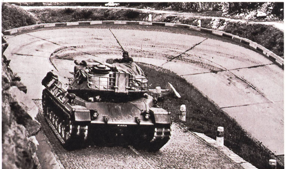
▼ Die alte Gotthard-Passstrasse diente als Versuchsstrecke. Hier eine Fahrt mit dem Leopard (1971). 8