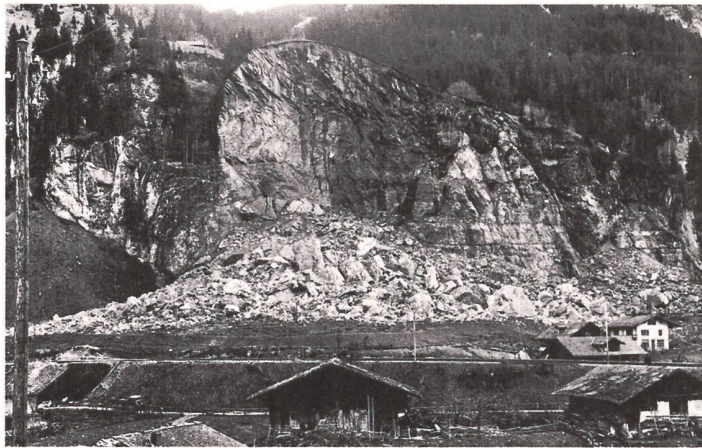
Trümmerlandschaft nach dem Explosionsunglück; abgebrochene Fluh, eingestürzter Bahntunnel.