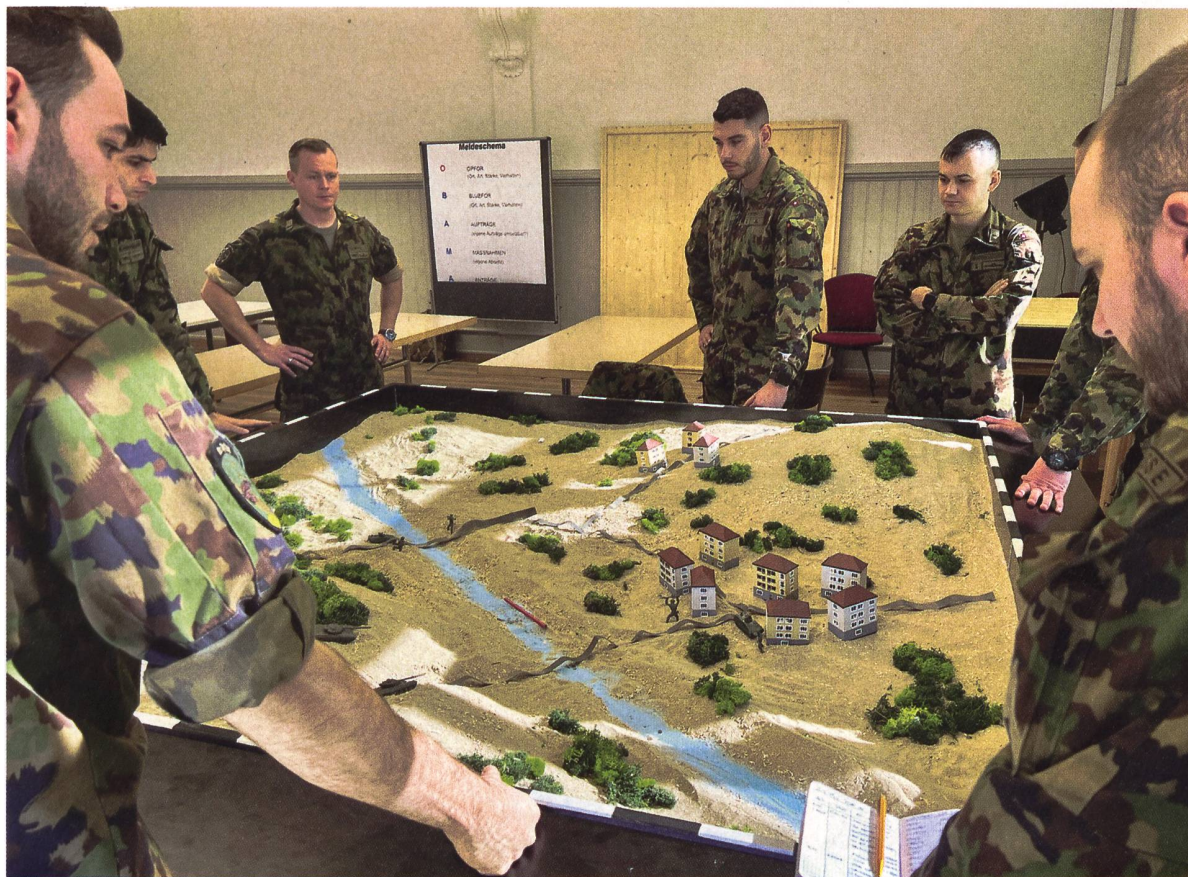
◀ Funkdrill am Sandkasten im TLG I der Pz/Art OS 22.