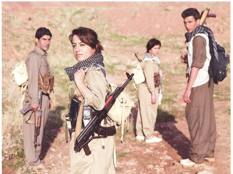
Weibliche Peschmerga, hier eine Aufnahme von 2015, können ein falsches Bild der Stellung der Frauen bei den Kurden vermitteln.

Das wirft die Frage nach der Stellung der Frauen in der kurdischen Gesellschaft auf. Wie in anderen ähnlich gelagerten Gemeinschaften weist das ländlich-konservative Milieu, in dem die Kurden traditionell leben, Frauen eine untergeordnete Stellung zu. Die islamische Religion verstärkt dies noch. Zwangsheiraten, körperliche Gewalt und insbesondere Ehrenmorde sind verbreitet: Nach den Schätzungen einer (gemässigten) Frauenorganisation sind auf dem Gebiet der ARK zwischen 1991 und 2006 12 000 Frauen durch Ehrenmorde getötet worden! Verbreitet bleibt auch auf dem Territorium der ARK die weibliche Beschneidung: Gemäss dem Bericht einer NGO erleiden 57 Prozent der Mädchen zwischen 14 und 18 Jahren dieses Schicksal. Allerdings hat sich die KRG jetzt mit einer gewissen Konsequenz dem Kampf gegen die weibliche Beschneidung verschrieben (nicht aber dem Kampf gegen die Ehrenmorde). Die Zahlen scheinen seit-