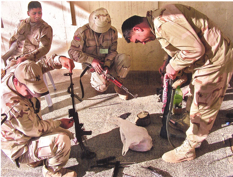
◀ Peschmerga und US-Soldaten reinigen ihre Ausrüstung in Erbil im 2005.