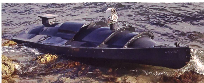
◀ Ein bereits im September 2022 auf der Krim gestrandetes USV der Ukraine. Mit solchen unbemannten Drohnen sollen am 29. Oktober 2022 russische Kriegsschiffe im Marinestützpunkt von Sewastopol angegriffen worden sein.

Seither wird festgestellt, dass die Aktivitäten der Schwarzmeerflotte beträchtlich zurückgefahren worden sind, dass Einheiten zwar in Sewastopol verbleiben und damit die Gefahr von Abschüssen der ballistischen Lenkwaffen des Typs «Kalibr» eher zurückgehen, dass auch amphibische Landaktionen derzeit eher unwahrscheinlich sind und dass aber Russland mehrere Einheiten – offenbar aus Respekt vor weiteren ukrainischen Angriffen dieser Art – von Sewastopol ins östlich gelegene Novorossiysk