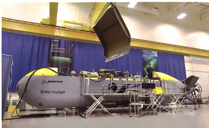
◀ Auch die USA entwickeln eine Vielzahl von unbemannten Systemen für verschiedenste Einsatzzwecke, wie hier die UUV «Orca» für die Navy.