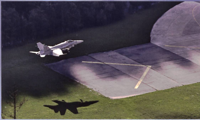
Eine F/A-18 landet auf dem temporären Ausweichflugplatz St. Stephan.