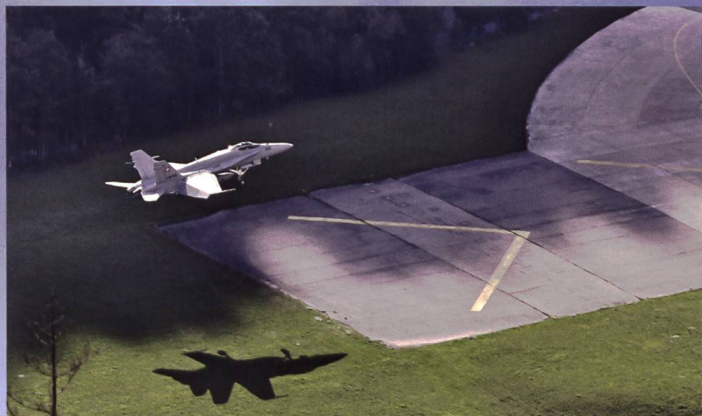
Eine F/A-18 landet auf dem temporären Ausweichflugplatz St. Stephan.