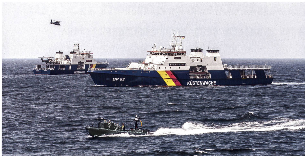
◀ Im Rahmen der ATLAS-Kooperation üben jährlich 38 europäische Spezialeinheiten Einsatzszenarien.