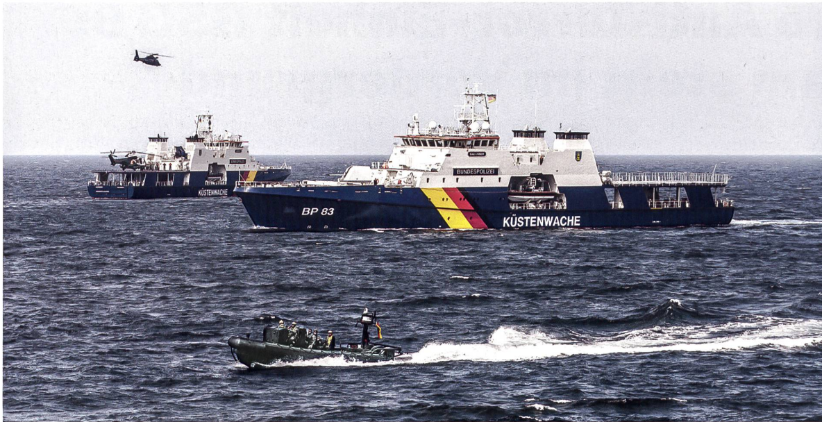
◀ Im Rahmen der ATLAS-Kooperation üben jährlich 38 europäische Spezialeinheiten Einsatzszenarien.