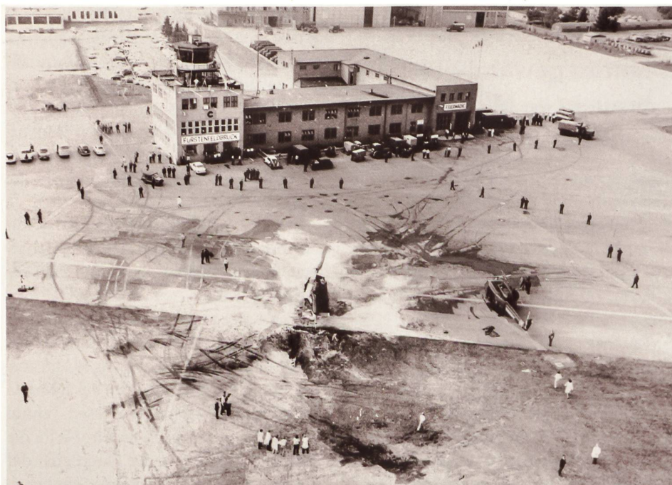
◀ 5. September 1972: Der Versuch bayerischer Polizisten, die israelischen Geiseln zu befreien, scheiterte in Fürstenfeldbruck.

Mogadischu brachte der GSG 9 und ihrem Kommandeur weltweite Anerkennung. Die folgenden Einsätze gegen Terroristen und Schwerstkriminelle blieben der Öffentlichkeit meist verborgen. Für mediales Aufsehen sorgte der Zugriff in Bad Kleinen, bei dem im Jahr 1993 ein RAF-Terrorist und ein GSG-9-Beamter ums Leben ka-