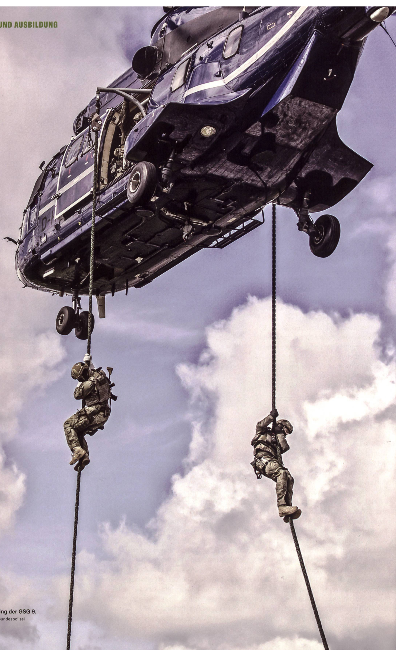
Einsatztraining der GSG 9.