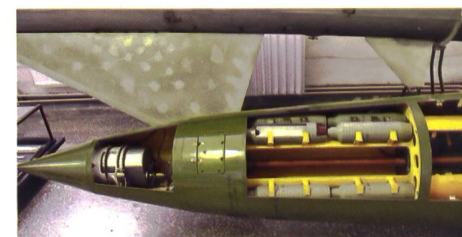
▲ Gefechtskopf des Raketensystems Tochka-U mit 50 Splitterbomblets.