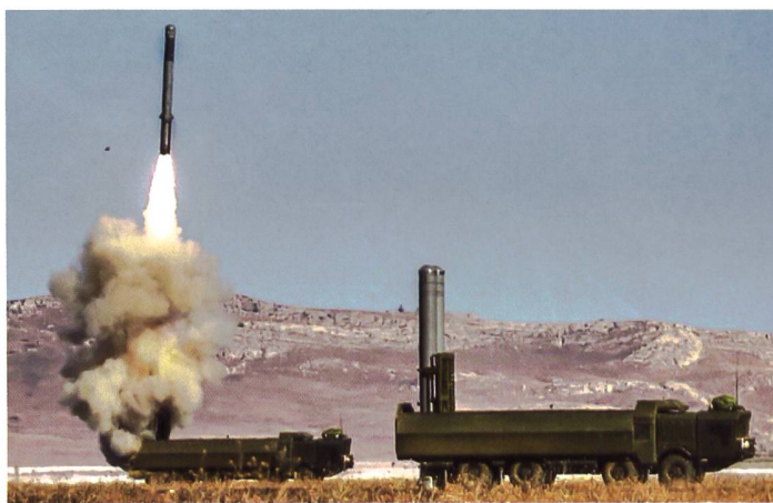
◀ Küstenverteidigungssystem Bastion beim Abschuss einer Lenkwaffe.

Einer der Hauptgründe für die starke Abhängigkeit Russlands von der Vielfalt vorhandener taktischer und operativer Lenk Waffen der Land- und Seestreitkräfte ist vermutlich das Versagen seiner Luftwaffe. Die Präzisionsangriffe mit Lenk Waffen erwiesen sich aber vor allem zu Beginn der Invasion als entscheidendes Mittel, um die ukrainischen Streitkräfte und die militärische Infrastruktur in Gebieten zu neutralisieren, in denen Angriffe aus der Luft zu riskant gewesen wären. Vor allem die grosse Zahl von Iskander-Abschüssen verursachte erheblichen Schaden und behinderte die ukrainischen militärischen Fähigkeiten. Russische Angriffe auf ukrainische Militäreinrichtungen, Eisenbahnen und Logistik im westlichen Teil des Landes stützten sich weitgehend auf Raketenangriffe. Unterdes-