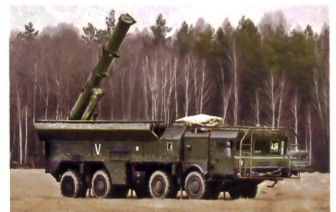
▼ Raketensystem Iskander-K mit Marschflugkörper 9M728.