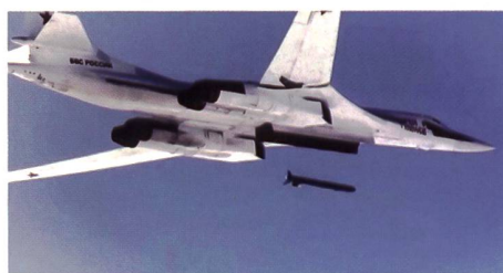
▲ Strategischer Bomber Tu-160 beim Einsatz

einer Cruise Missile Kh-101.