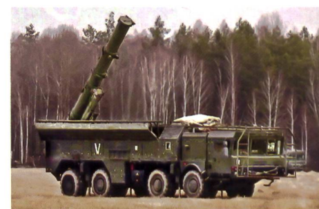
▼ Raketensystem Iskander-K mit Marschflugkörper 9M728.

einer Cruise Missile Kh-101.