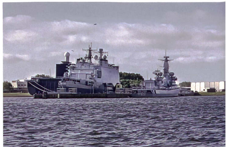
► Schiffe der niederländischen Marine im Hafen von Den Helder.

Die F-35 werden bereits seit 2019 sukzessive in die Luftwaffe integriert. Bis 2030 werden vier neue Fregatten in Dienst gestellt, dazu kommen neue U-Boote. Die neuen Kampfdrohnen «Reaper» werden ab 2023 ope-