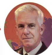
BRIGADEGENERAL JAN BLACQUIÈRE

Der gesamte Personalbestand des Verteidigungsministeriums und der Streitkräfte beläuft sich auf rund 68'000 zivile und militärische Personen.