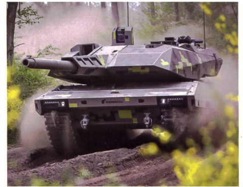
Der vor Kurzem von Rheinmetall vorgestellte KF51 Panther ist eine bemerkenswerte Weiterentwicklung des Leopard 2. Einigen der aufgeführten Designmerkmalen vermag er allerdings nicht zu entsprechen.

Sicherheit in Europa zu leisten, bündnisfrei und frei in den eigenen Entscheiden.