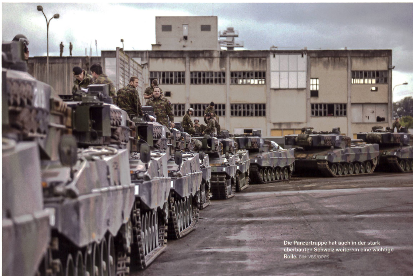
Die Panzertruppe hat auch in der stark überbauten Schweiz weiterhin eine wichtige Rolle.

Selbst wenn in der Staatsführung von Putins Russland eine Abwägung von Chancen und Risiken vorgenommen worden wäre, müssen wir feststellen, dass schon seit Jahren der Einsatz der Streitkräfte gegen Nachbarländer als Mittel der eigenen imperialen Machtpolitik Anwendung gefunden hat. Beispiele dafür sind etwa Tschetschenien, Georgien, Ukraine, oder etwas weiter entfernt in Syrien. Der durch Krieg angerichtete Schaden ist in unserer Betrachtung