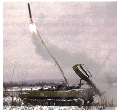
▲ Minenräumsystem UR-77 beim Abschuss explosiver Räum-schlangen.