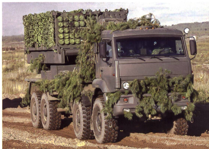
◀ Fernverminderungssystem ISDM kann grossflächig Personen- und Panzerabwehrminen einsetzen.