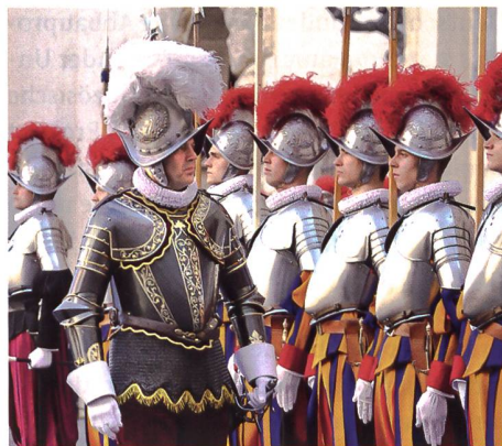
Der Kommandant Oberst Christoph Graf und seine Schweizergarde in Paradeuniformen.

Die Arbeiten werden von der Stiftung und den vatikanischen Behörden auf der Grundlage einer Kooperationsvereinbarung betreut und begleitet. Baubeginn ist für 2026 vorgesehen. Es wird mit Gesamtkosten von 50 Millionen Franken gerechnet.