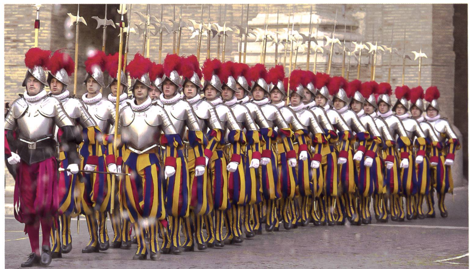
Die Schweizergarde wurde jüngst aufgestockt.

Die Investitionen werden auch durch private Spenden aus der Schweiz und dem Ausland, religiösen Gemeinschaften und Kantonen getragen. Den Hauptteil im Umfang von 42 Millionen Franken steuert die Eidgenossenschaft bei. Im 2029 soll die Renovation abgeschlossen sein.