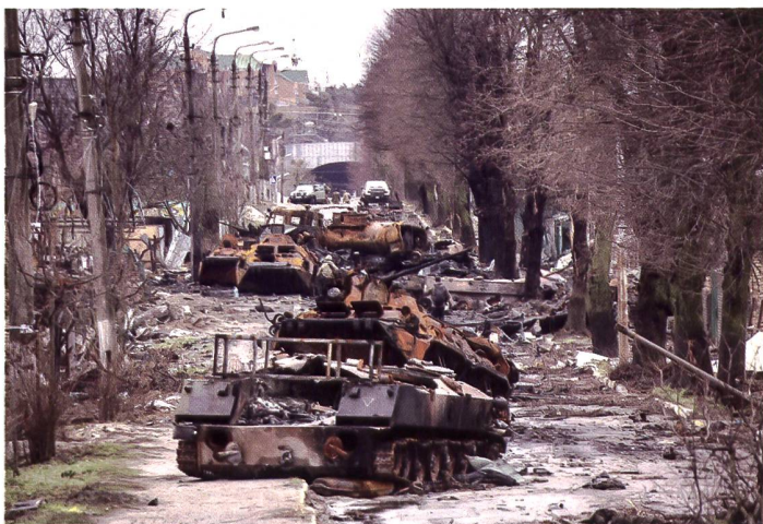
Verbrannte Erde in der Ukraine.