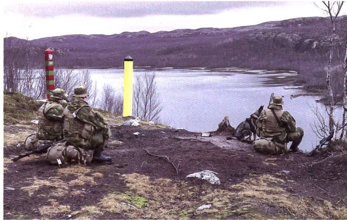
Grenze bewachen im hohen Norden.

Während Russland in die Ukraine einmarschierte, hielt Norwegen eine grössere Militärübung mit internationaler Beteiligung auf ihrem Territorium ab. Mit beinahe 35000 Teilnehmenden aus 28 Nationen, 200 Flugzeugen und 50 Schiffen war «Cold Responde 22» wiederum ein Megaevent. Der Hauptteil der Übung begann am 14. und endete am 31. März 2022. Trainiert wurde hauptsächlich die Verteidigung Norwegens unter erschwerten, also winterlichen Bedingungen. Ein tragischer Zwischenfall überschattete das Manöver, als eine MV-22 Osprey bei stürmischen Wetterbedingungen in Nordnorwegen abstürzte und vier GIs ums Leben kamen.