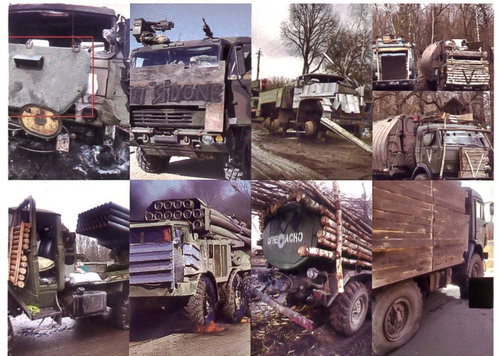
Improvisiert: russische Panzerungen.

gavare mit. Im März waren Pläne für eine Sicherheitspartnerschaft zwischen beiden Staaten durchgesickert. Darin hatte es geheissen, das Abkommen solle unter anderem die Unterstützung der Regierung der Salomonen durch chinesische Polizei und Militär bei Fragen der Gesellschaftsordnung und der Katastrophenabwehr umfassen. Neuseelands Ministerpräsidentin Jacinda Ardern hatte erklärt, sie sehe das Vorhaben mit Blick auf eine Militarisierung der Region mit grosser Sorge. Australien und die USA äusserten sich ähnlich. Die Salomonen mit weniger als einer Million Einwohnern liegen deutlich näher an Australien und Neuseeland als an China. Sc