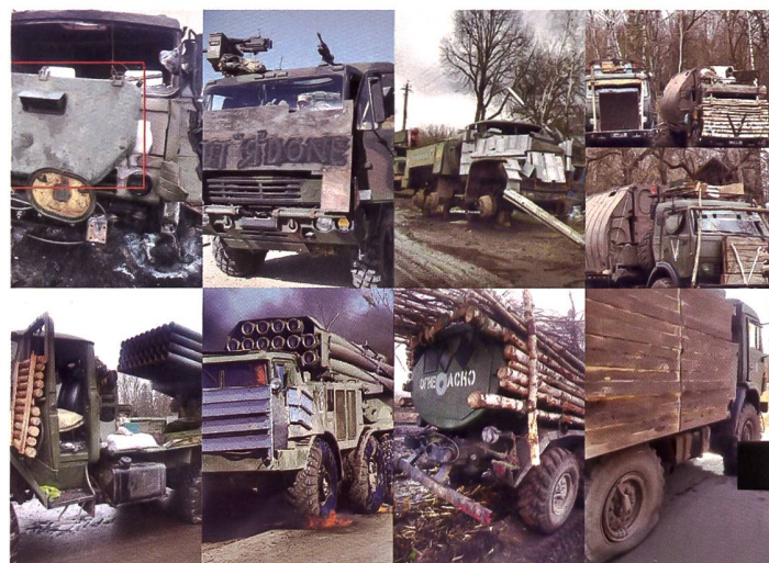
Improvisiert: russische Panzerungen.

gavare mit. Im März waren Pläne für eine Sicherheitspartnerschaft zwischen beiden Staaten durchgesickert. Darin hatte es geheissen, das Abkommen solle unter anderem die Unterstützung der Regierung der Salomonen durch chinesische Polizei und Militär bei Fragen der Gesellschaftsordnung und der Katastrophenabwehr umfassen. Neuseelands Ministerpräsidentin Jacinda Ardern hatte erklärt, sie sehe das Vorhaben mit Blick auf eine Militarisierung der Region mit grosser Sorge. Australien und die USA äusserten sich ähnlich. Die Salomonen mit weniger als einer Million Einwohnern liegen deutlich näher an Australien und Neuseeland als an China. Sc