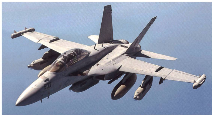
Eine Boeing EA-18G Growler.