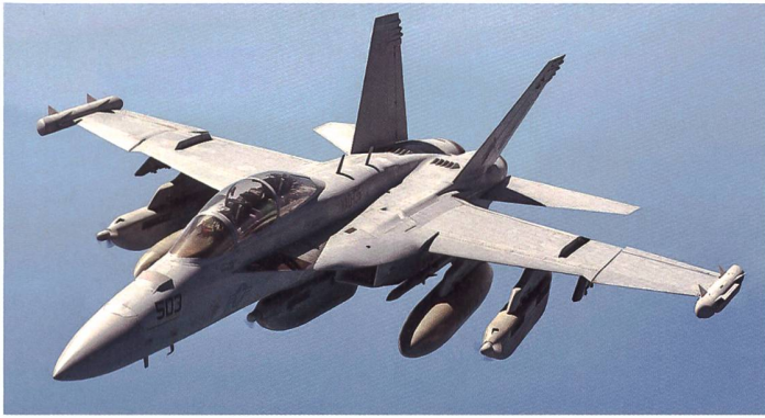
Eine Boeing EA-18G Growler.