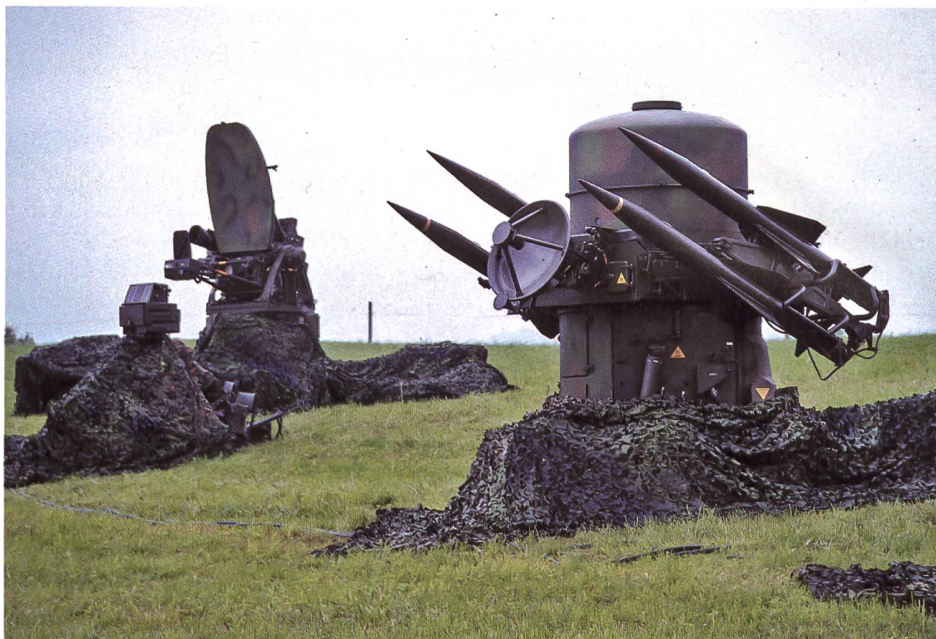
Das mobile Fliegerabwehrenkaffensystem RAPIER soll ausser Dienst gestellt werden.

Im Rahmen der Entsorgung kann das Material zum Teil verwertet – recycelt – und