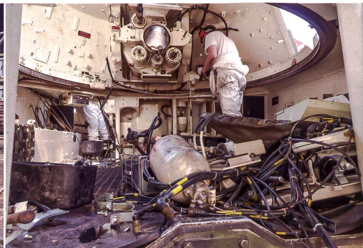
Impressionen von der Teilausserdienststellung M109.