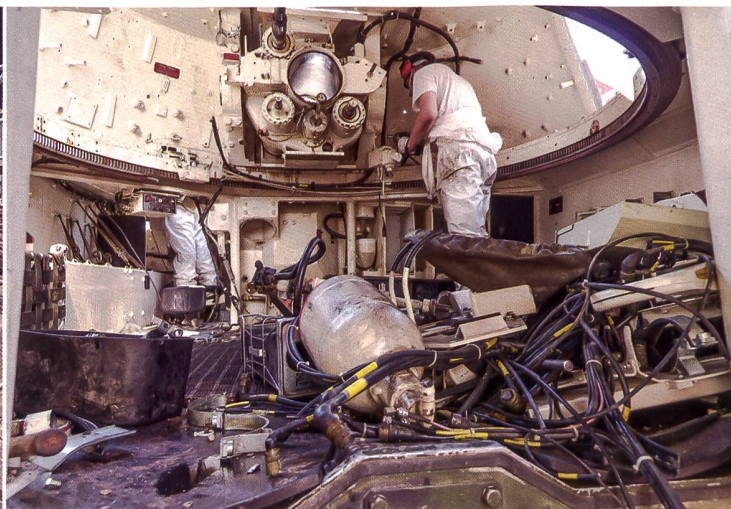
Impressionen von der Teilausserdienststellung M109.