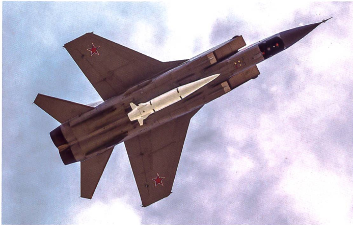
◀ Dieses russische Kampfflugzeug MiG-31K ist mit der Lenkwaffe Kinzhal bestückt.

te vorhanden sind. Die nuklearfähige, luftgestützte Version wird vermutlich erst abgeschossen, wenn sich das Flugzeug im Überschallflug befindet. Dadurch soll eine Verwundbarkeit des Systems durch US-Luft- und/oder Raketenabwehr wesentlich verringert werden. Die Rakete beschleunigt innerhalb von Sekunden nach dem Abschuss auf Hyperschallflug und kann nur schwer bekämpft werden. Gemäss Herstellerangaben soll die maximale Reichweite je nach Trägerflugzeug zwischen 2000 und 3000 km liegen.