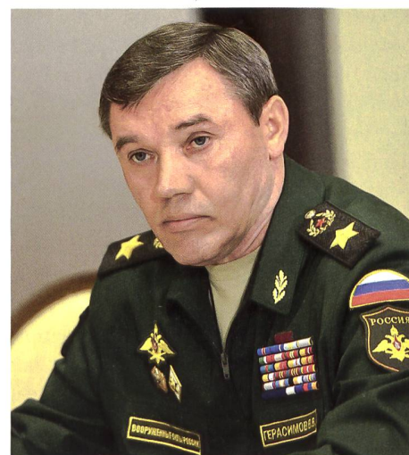
► Der russische General Waleri Gerassimow.