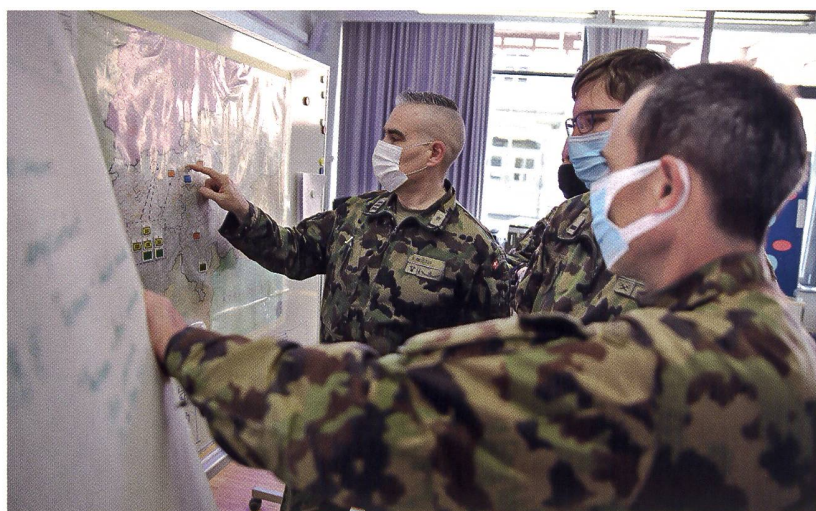
Operative Schulung: Ausbildung an der HKA seit 2012.

Bis Ende des letzten Jahres war die Operative Schulung (Op S) Teil der HKA. Neu ist die Op S dem Armeestab unterstellt. Ein Abschied von einer Schule, die 2012 zur HKA stiess, dort gut aufgehoben war und nun weiterentwickelt werden soll. Viel Herzblut legte die HKA in diese Ausbildung – es möge nun eine neue Ära gelingen, denn operativ-strategische Schulung tut not, nach wie vor.