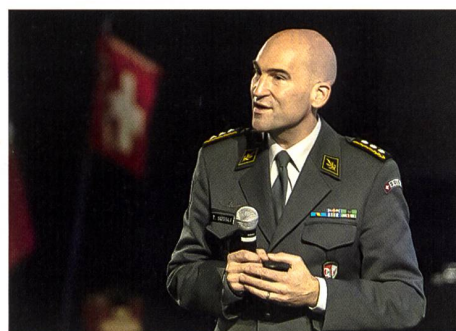
▲▶ KKdt Thomas Süssli, Chef der Armee.