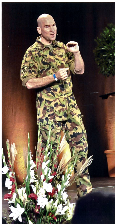
Der Chef der Armee, KKdt Thomas Süssli, spricht zu den Herausforderungen 2030.

DPSA) seit dem 1. Januar 2020, dokumentierte unter anderem auf eindruckliche Weise die Herausforderungen, mit denen er von Beginn weg konfrontiert war. Die Pandemie forderte Höchstleistung von allen vom ersten Tag an. Dies war mit Hilfe der Miliz aus dem Stand möglich. In seinem Rück- und Ausblick streifte er verschiedene Themen der Weltlage und zukünftige Strategien und Doktrin des Militärischen Nachrichtendienstes.