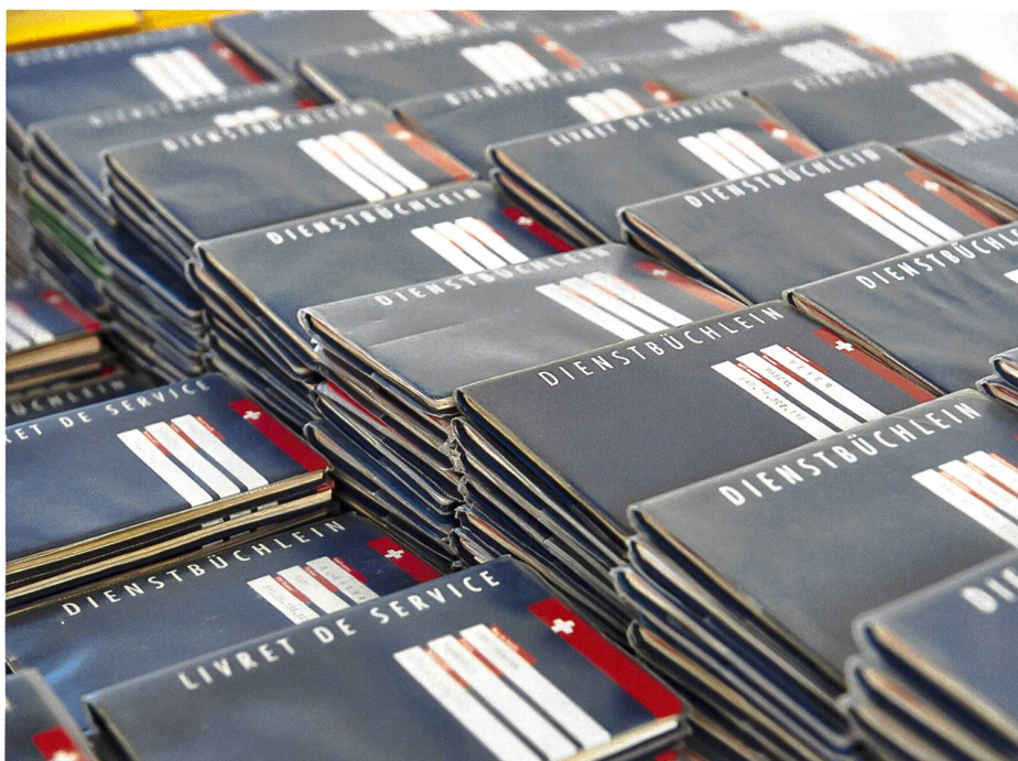
▼ Das Dienstbüchlein in der klassischen Form könnte bald ausgedient haben.

liz auseinandergesetzt. In mehreren Workshops mit diversen Anspruchsgruppen wie stellungspflichtigen Teenagern, Milizangehörigen in Ausbildung sowie Kadern in Ausbildung und in Wiederholungskursen wurde eine sogenannte «Customer Journey» aufgezeichnet. Damit wurden die wunden Punkte jeder Phase des militärischen Lebenswegs erfasst. Gemeinsam sind Ansätze zur Lösung der Anforderungen erarbeitet worden, die nun mit Fachleuten im User Experience Design weiter zu Prototypen für «Microservices» in Form von Applikationen entwickelt werden.