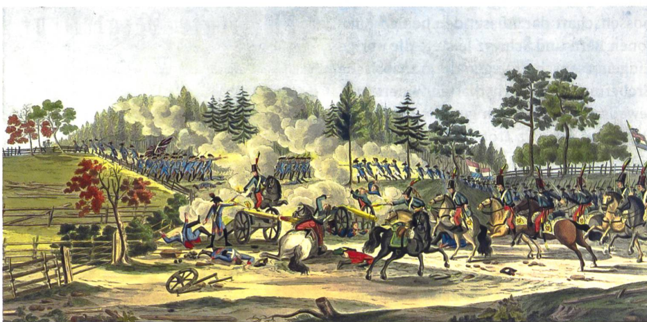
Schlacht von Fraubrunnen 1798.

Auch bei diesen regelmässig stattfindenden eidgenössischen Schützenfesten trafen sich Männer aus verschiedenen Regionen der Schweiz zum geselligen Zusammensein und leisteten im Zusammenspiel mit anderen eidgenössischen Vereinen als ideale Plattformen des politischen Meinungsaustausches einen nicht zu unterschätzenden Beitrag für ein nationales Bewusstsein, das es im sogenannten Ancien Régime – wenn überhaupt – nur ansatzweise gegeben hatte. 16