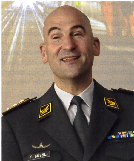
Der Chef der Armee, KKdt Thomas Süssli, als Referent.