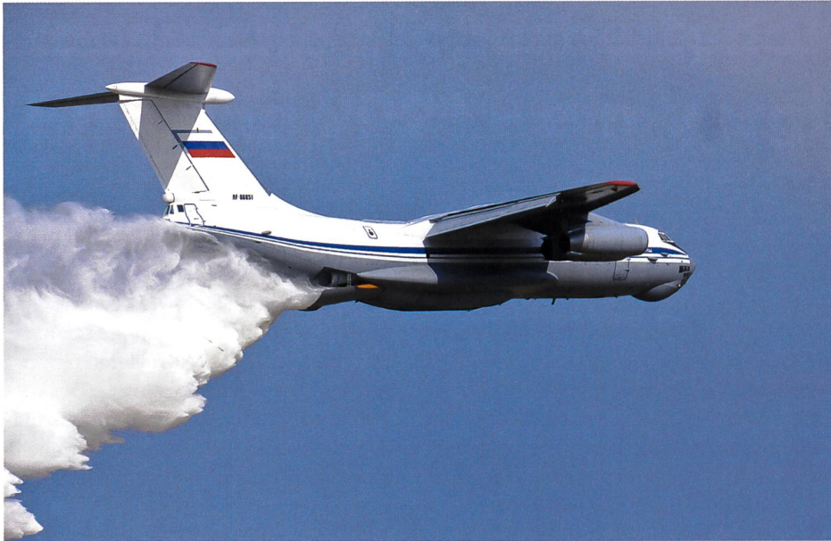
Demonstration eines Löschflugzeuges des russischen Ministeriums für Notfallsituationen.